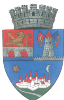
PRIMĂRIA MUNICIPIULUI TIMIȘOARA